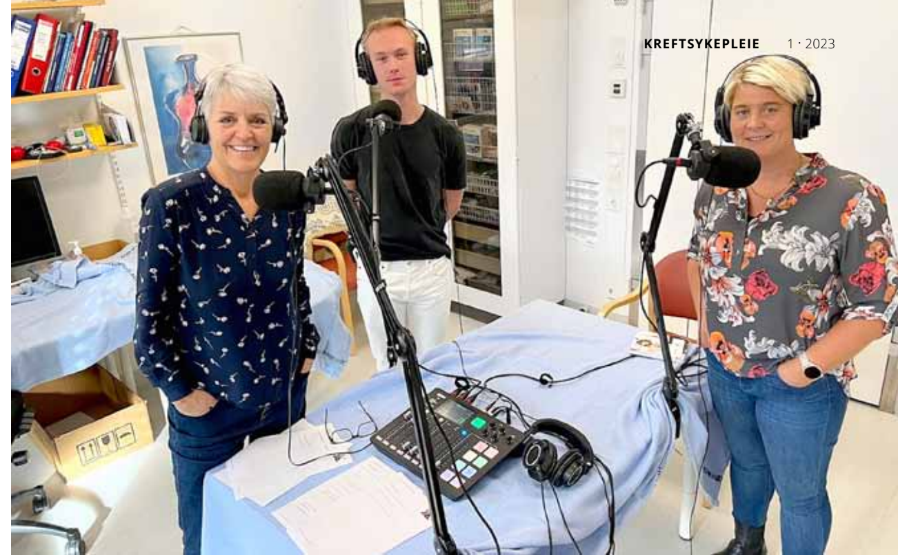
SyktFrisk har to portable lydstudio, ett på Oslo universitetssykehus Ullevål og ett på Sørlandet sykehus HF. Opptak kan gjøres her, eller redaksjonen kan reise ut og hjelpe med opptak. Redaksjonen støtter også med for- og etterarbeid og publisering.

I episodene om generelle tema kan pasienter og pårørende få informasjon og kunnskap om kostholdets betydning før, under og etter sykdom, hva vi bør spise og hvordan vi kan ta gode kostvalg og vekke sunn matglede. Videre kan de få kunnskap om hvorfor være fysisk aktive under sykdom, hvordan de bør trene og hvordan finne motivasjon til å komme i gang. Pasienter og pårørende kan også høre om retten til å medvirke i egen behandling, og helsetjenestens plikt til å legge til rette for dette. De får mulighet til å lytte til erfaringer, tips og råd om hvordan ta vare på barn og unge som opplever at en i familien er alvorlig syk og dør, og om rettigheter og støtteordninger. I tillegg er det utgitt episoder om stressmestring og